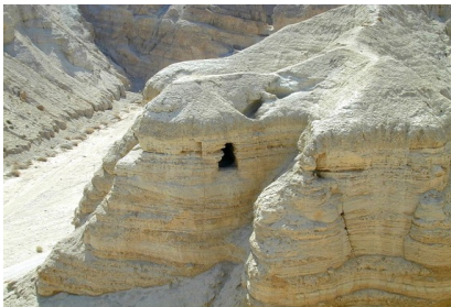
Qumranhöhle und Schriftrolle

Fahrt nach Qumran zur ehemaligen jüdischen Gemeinschaftssiedlung am Toten Meer: Blick auf die Höhlen, in denen die berühmten Schriftrollen gefunden wurden.