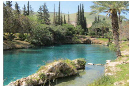
Die Mikwe zum Himmel – Bad in Gan Hasloscha

Welt und mit Josephs Werkstattkirche ; weiter zum Besuch des „ Nazareth Village “ - ein Dorf wie zu Jesu Zeiten. (Wenn die Zeit es erlaubt, Stopp in Kana , Besuch der Hochzeitskirche und der Unterkirche mit alten Steinkrügen ) Fahrt ins Jordantal mit Halt in Beth Alfa , Besichtigung der Synagoge , Baden in Gan Hasloscha , einem kleinen Paradies am Rand der jüdischen Wüste. Fahrt nach Jerusalem auf den Skopus mit einem 1. Blick auf die Heilige Stadt. Fahrt nach Bethlehem ins Hotel Paradies für 4 Nächte.