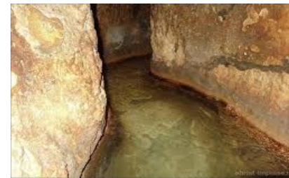
Hiskija-Tunnel in Jerusalem

6. Tag, Mittwoch, 9.10.2024 Jerusalem : Besuch der Gedenkstätte für die Opfer des Nationalsozialismus, Jad Vashem mit dem Tal der Gemeinden ; Besuch des Israelmuseums mit der Ausstellung der Qumranfunde und einer Jerusalem-Miniatur ; Fahrt zur Menorah vor der Knesseth , dem israelischen Parlament.