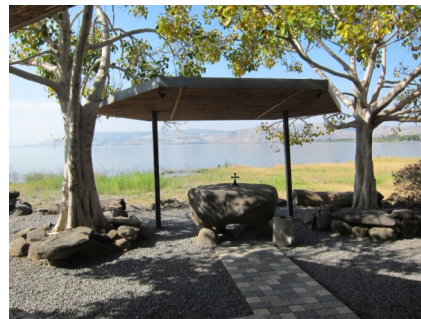
Dalmanuta - Ort der Abendmahlsfeier

3. Tag, Sonntag, 6.10.2024 Fahrt nach Tabgha , einer kleinen Kirche mit den schönsten Mosaikböden aus dem 4. Jhd. am Ort der biblischen Brotvermehrung. Anschl. Gottesdienst mit Hl. Abendmahl in Dalmanuta direkt am See. Fahrt nach Cäsarea Philippi , Banjas, der Ort des „Petrusbekennnisses“, anschl. Wanderung am Jordan entlang zum kleinen Wasserfall (1,5 h). Fahrt über den Golan und durch Dru-sendörfer zurück nach Tiberias, unterwegs Bademöglichkeit im See Genezareth.