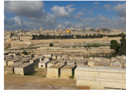
Blick vom Ölberg auf den Tempelberg

Gethsemane mit uralten Olivenbäumen und der „ Kirche aller Nationen “ mit der Verratsgrötte.