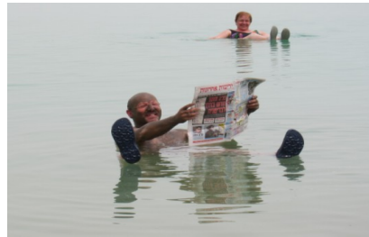
Im Toten Meer – echt oder gestellt?

Zeit am Toten Meer zum Baden; kleine Wanderungen möglich.