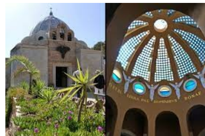
Engelskapelle bei den Hirtenfeldern in Bethlehem

5. Tag, Dienstag, 8.10.2024 Bethlehem : Wir besuchen die Geburtskirche mit der Geburtsgrötte und die Hirtenfelder mit der Engelskapelle.