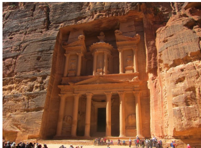
Schatzhaus des Pharao

Petra, biblische Felsenstadt der Nabatäer , Nachfahren des Volkes Nebojath (1. Mose 25, 12-18; 1. Chr. 1, 29; Jes 60, 7). Die nabatäische Geschichte geht auf 312 v. Chr. zurück. Petra befindet sich in einer einzigartigen, rosaroten Felsenlandschaft und war durch den Karawanenhandel reich geworden. Gang durch die Felsenspalte, den Sik, zum „Schatzhaus des Pharao“ , eines der schönsten Monumente der Stadt, zu Felsengräbern, Tempeln, Theater u.a.m. Aufstieg zum Opferplatz Zip Atuf . Abstieg über den Priesterweg vorbei am Felsengrab Ed-Der und durch das Wadi Farasa zurück ins Hotel.