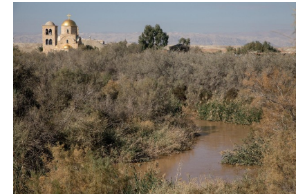
Jordantal nahe der Taufstelle

8. Tag, Freitag, 11.10.2024 Fahrt zur israelisch-jordanischen Grenze. Einreise in das Königreich Jordanien ; Empfang durch die Reiseleitung. Fahrt ans Jordanufer zum biblischen Bethany, wo Johannes taufte. In einer seltsamen Landschaft entstanden byzantinische Siedlungen mit Kirchen und einem Kloster aus dem 5.-6. Jh., das freigelegt worden ist. Tauferinnerungsgottesdienst am Jordan.