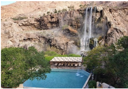
Thermalquellen Ma'in Hot Springs

Fahrt zu den Thermalquellen Ma'in Hot Springs mit Bademöglichkeit inmitten der Wüste. Weiter über die Königsstraße mit grandiosen Gebirgslandschaften und dem Mujib-Wadi . Wenn noch Zeit ist: Besuch der Kreuzfahrerburg Kerak . Dann nach Süden bis Petra . Stopp an der Mosequelle ; Übernachtung für 2 Nächte in Petra, Hotel Petra Icon